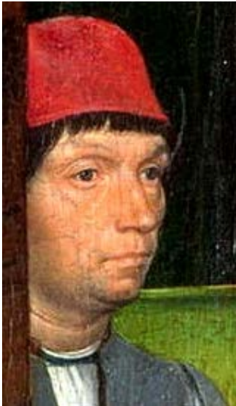
Selbstbildnis auf dem Donne-Altar in der National Gallery zu London

Hans Memling, auch Jan van Mimmelynghe genannt, Sohn von Hamann Momilingen, wurde zwischen 1433 und 1440 in Seligenstadt bei Aschburg geboren. Über seine Jugendjahre ist nichts bekannt, seine Eltern verstarben vermutlich um 1450 an der Pest. 1465 findet sich eine urkundliche Erwähnung, der zufolge er das Bürgerrecht in Brügge erworben hat.