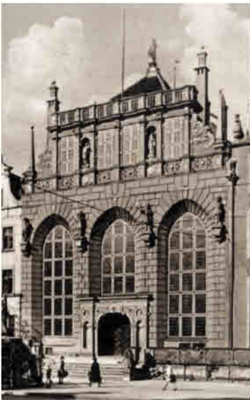
Artushof um 1930