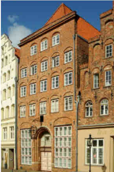
HAUS HANSESTADT DANZIG