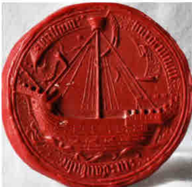
Große Staatssiegel 1400-1939 sigillum burgensium in dantzike