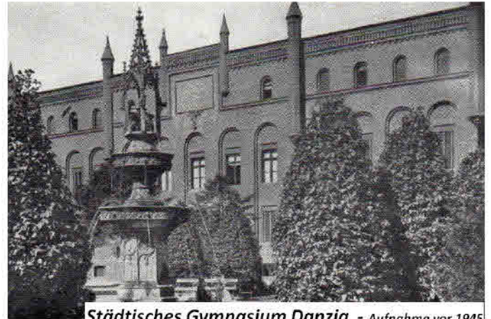
Städtisches Gymnasium Danzig - Aufnahme vor 1945

Jahrhunderte lang war unsere Schule als „Gymnasium Academicum“ (...) der geistige Mittelpunkt unserer Stadt und konnte ihre Stellung ständig verbessern und festigen und mit der Zeit einen ausgezeichneten Ruf als hervorragende Lehranstalt erringen. Es war der Ruhm der Schule, dass sie auf vielen Wissensgebieten eine grosse Anzahl berühmter Gelehrter und hervorragender