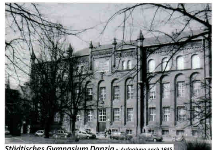
Städtisches Gymnasium Danzig - Aufnahme nach 1945

Das Städtische Gymnasium bekam am 3. August 1837, dem Geburtstag von König Friedrich-Wilhelm III. ein neues Schulgebäude nach den Plänen des berühmten Staatsbaumeisters Karl Friedrich Schinkel und seitdem prangt oben auf dem Giebel auch heute noch der Spruch „ARTIUM LIBERALIUM STUDIIS SACRM“ (geweiht dem Streben nach wahrer Menschenbildung lautet die freie Übersetzung). (...)