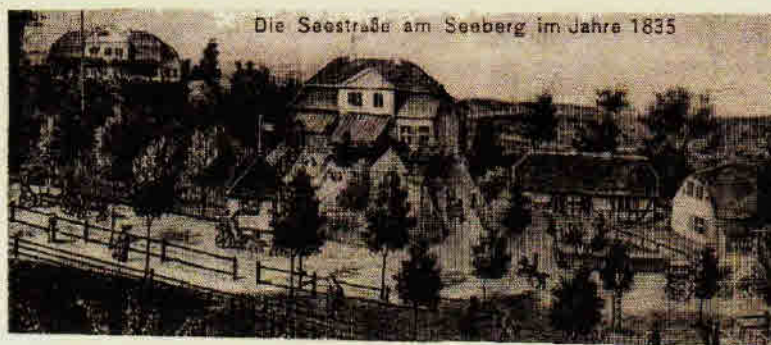
Die Seestraße am Seeburg im Jahre 1835