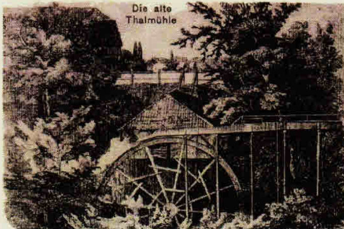
Die alte Thalmühle

Versagen mir auch 'mal die Füße, Nehm ich 'n Schluck - doch nicht zu gross -, Aus meiner Dose eine Prise, Und dann, Marjaunchen, frisch drauf los.