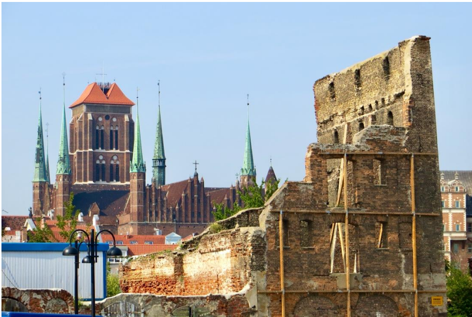
Über Jahrzehnte erinnerten die Ruinen auf der Speicherinsel in Danzig an Krieg und Zerstörung aber auch an Flucht und Vertreibung