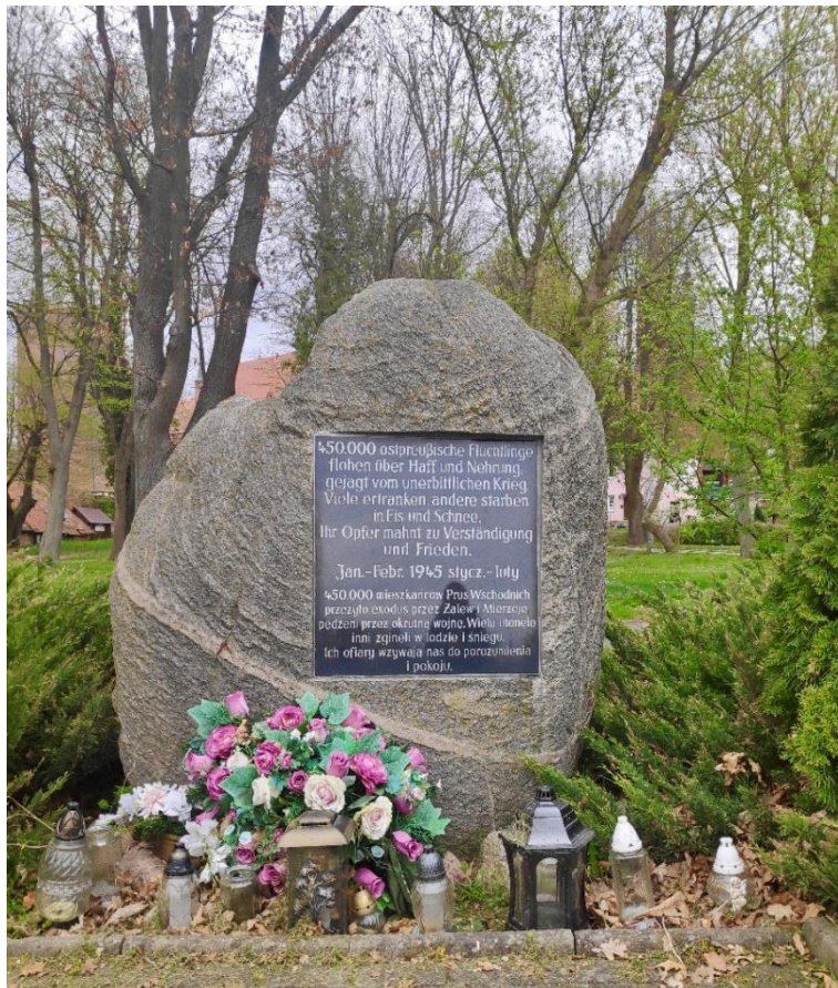
Der Gedenkstein in Frauenburg am Frischen Haff erinnert an 450.000 deutsche Flüchtlinge von Jan.-Feb. 1945